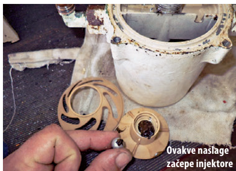
Ovakve naslage začepi injektore

Razvojem tehnologije motora, i motora italija 12 loz, aniji, tiši, la. ši i e. onomičniji, no 2je, no o 1jetljiviji na neprijatelje motora, e i prljavštine. motora je znati, a 80 motora 1 motora nova gene... izlazi iz motora. oji je, . ao i 121tav za na... mje1to g, je, olazi, o na. 2... nja vo, e, neč1toća. i lina, a... ina, a ča. i algi. 1vom, alnjem 2t2t, ta. vi ne... 2 go... mog2 začepiti 2lazni -lta... ove1ti, o 1tva... štetnih na1laga na o1jetljivim 121tavima za 2... go... va.