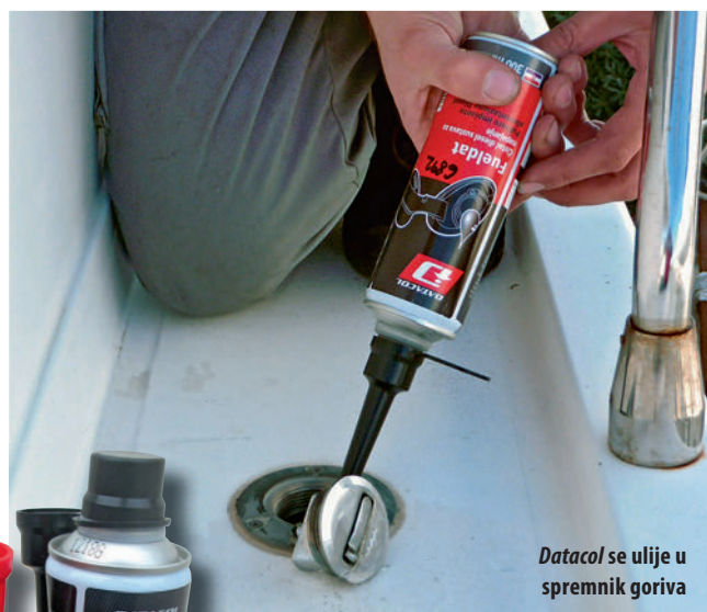
Datacol se ulije u spremnik goriva