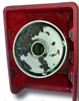
Alge nakupljene u filteru goriva

gene...rije. ...čin. ovito i je, no1tavno...e-šenje za iz...jegavanje ova. vih...e...lema 12...e...jalni a, itivi. oji 1e, o, aj2 go...v2. ...a. ve...valitet-ne a, itive za...enzin1. e i, izel1. e